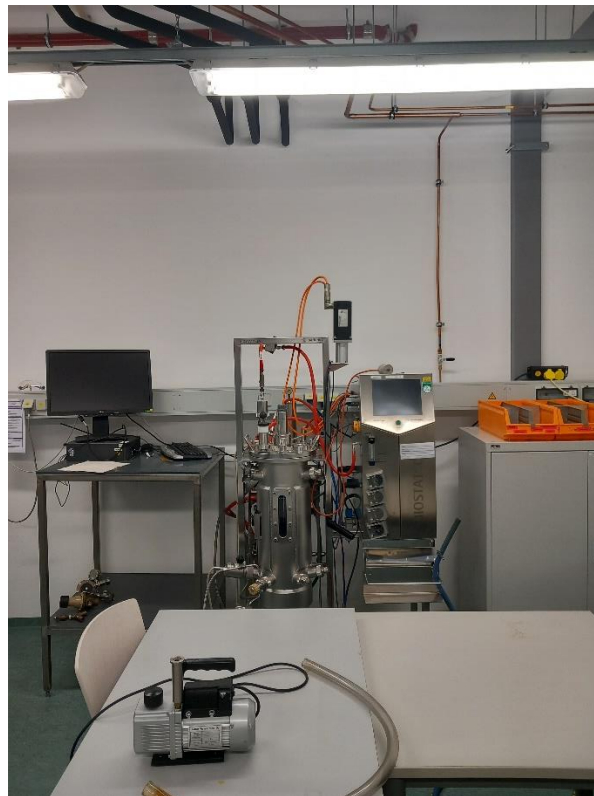
Fermenter, mit dem bis zu 15kg Protein hergestellt werden kann