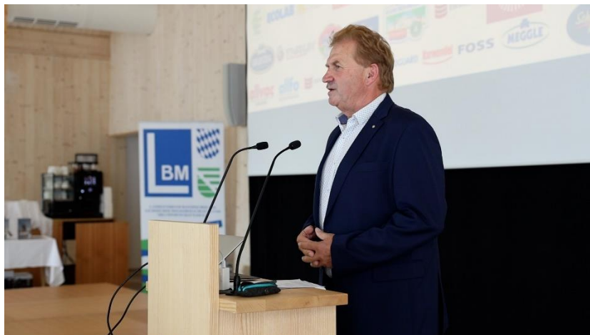
Landesvorsitzender des LBM Ludwig Weiß