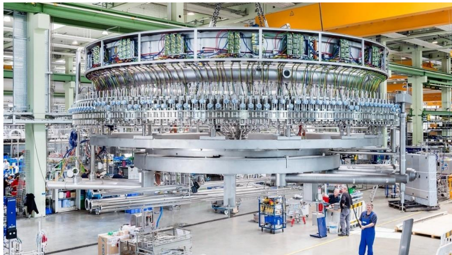
Abfüllanlage am 63 Tonnen Kran