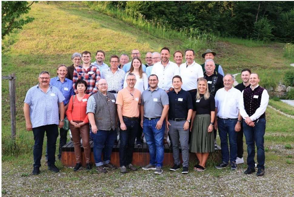
Bild vom Gesamtvorstand und Beirat