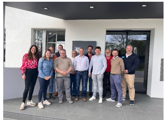
Teilnehmer der „fortgeschrittenen Schulung Käsewissen“